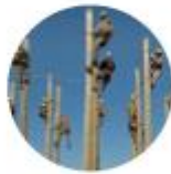
Praca fizyczna na wysokościach