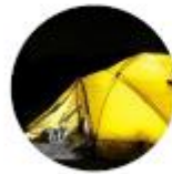
Wypad pod namiot