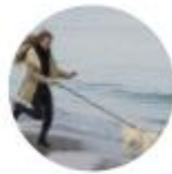
Spacerzy z psem